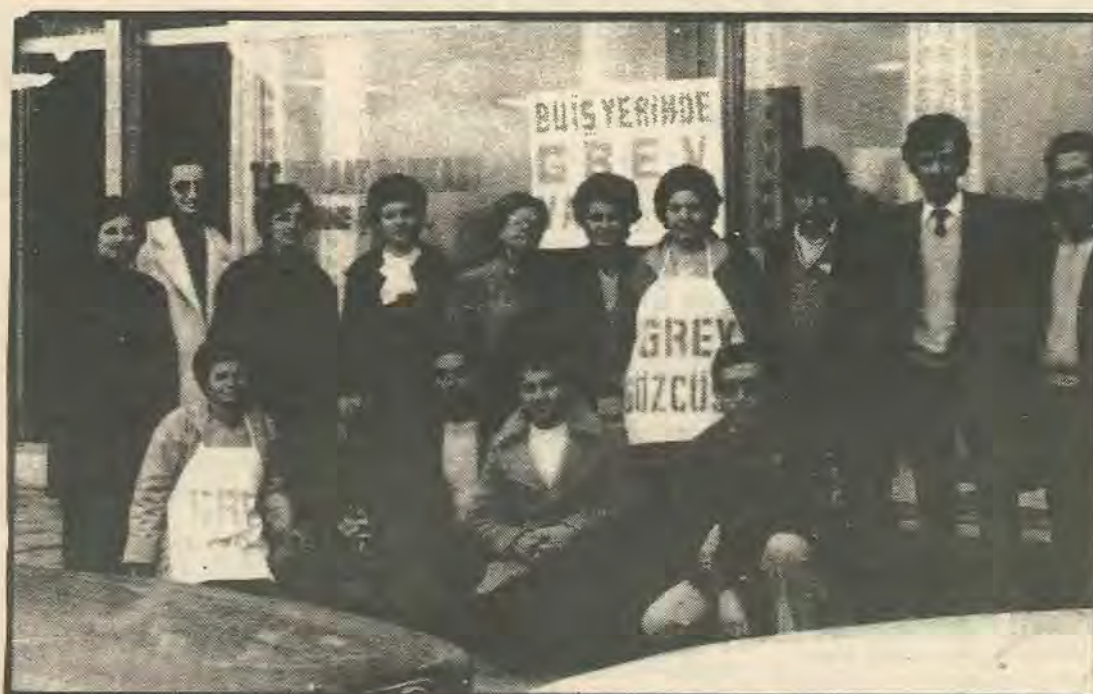
Οι κινητοποιήσεις των Τ/Κ εργαζομένων συνεχίζονται και μετά τη γενική απεργία του Δεκεμβρη. Η αποικιακής μορφής οικονομική συμφωνία με την Τουρκία στηρίζεται στην καταπίεση των εργαζομένων.

Όμως ανάλογες θέσεις πήραν και οι ηγεσίες των Ε/Κυπριακών αριστερών κομμάτων ΑΚΕΛ και ΕΔΕΚ. Και είναι απ' εδώ που ξεκινούν οι ευθύνες τους για το συνεχιζόμενο διαχωρισμό της Ε/Κυπριακής και Τ/Κυπριακής εργατικής τάξης. Γιατί από τη στιγμή που οι ηγεσίες αυτές δέχονται τες μεθόδους των Ε/Κυπρίων αστών δεν μπορούν να βοηθήσουν και να προσφέρουν προς την κατεύθυνση της κοινής δράσης των Ε/Κυπριακών και Τ/Κυπριακών εργατικών κομμάτων και τέλος στη δημιουργία του κοινού μετώπου Ε/Κ και Τ/Κ εργαζομένων για τη διεκδίκηση της εξουσίας. Επομένως αν ο Ντεν-